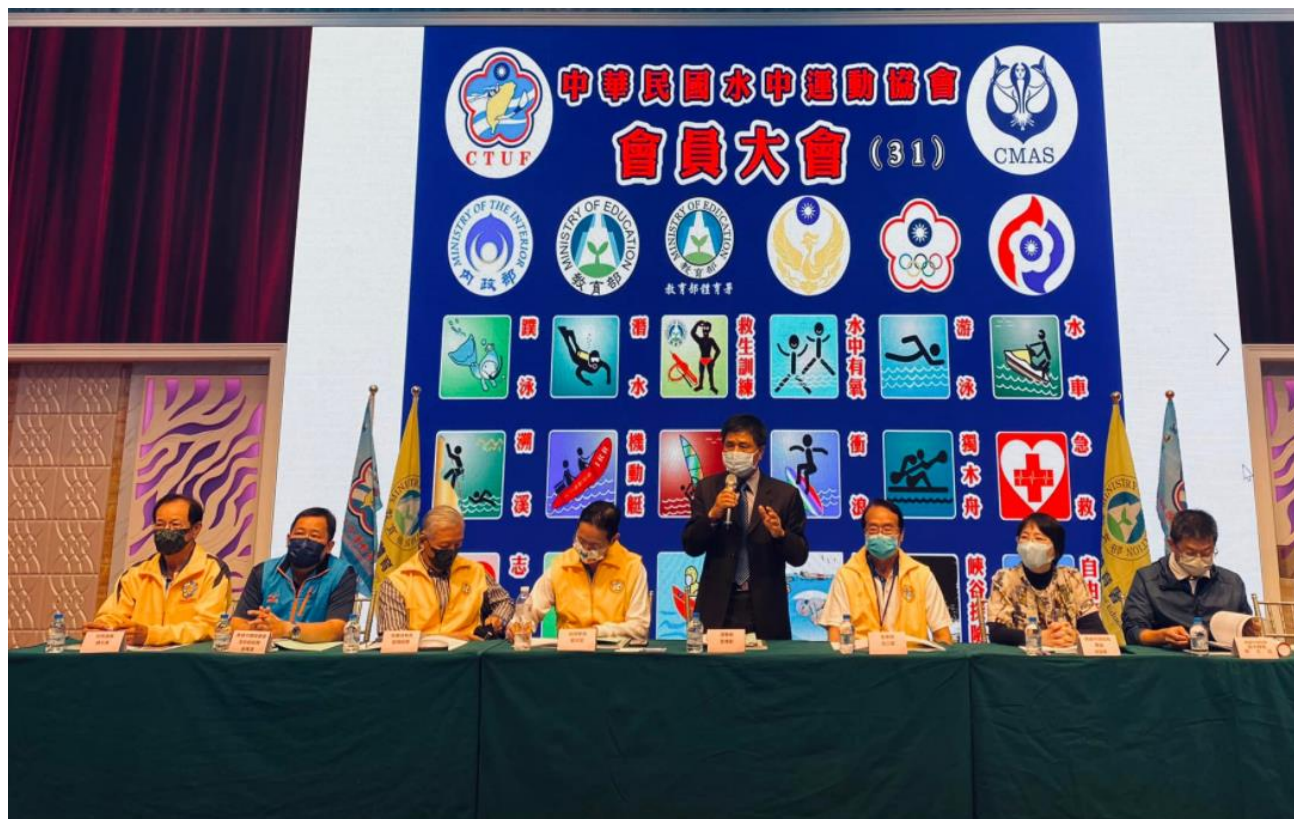
大會主席—曾應鉅理事長致詞