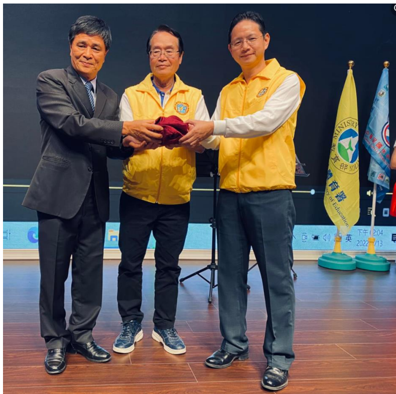
新舊任理事長交接儀式