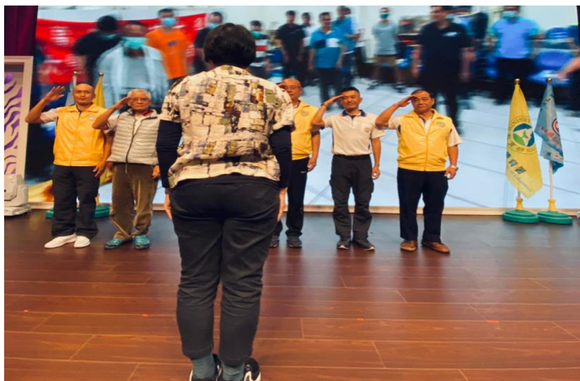
頒發有功人員及單位獎勵_1