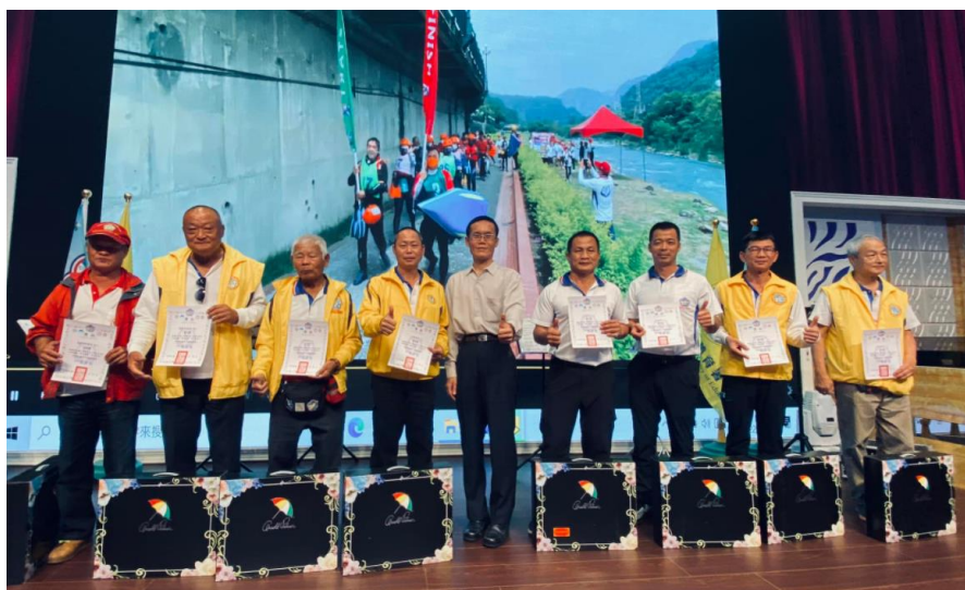
頒發有功人員及單位獎勵_4