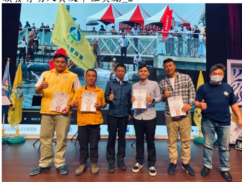
頒發有功人員及單位獎勵_3