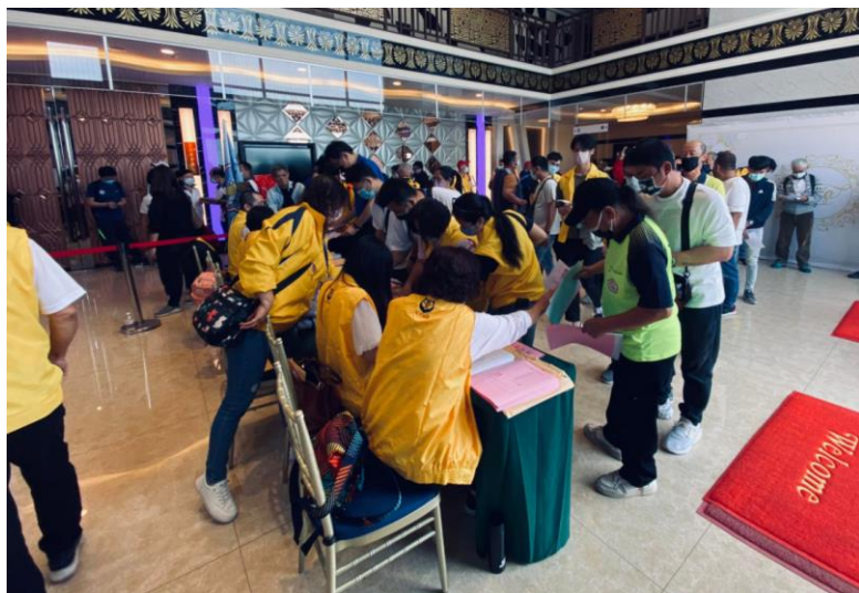
會員依序領票情形