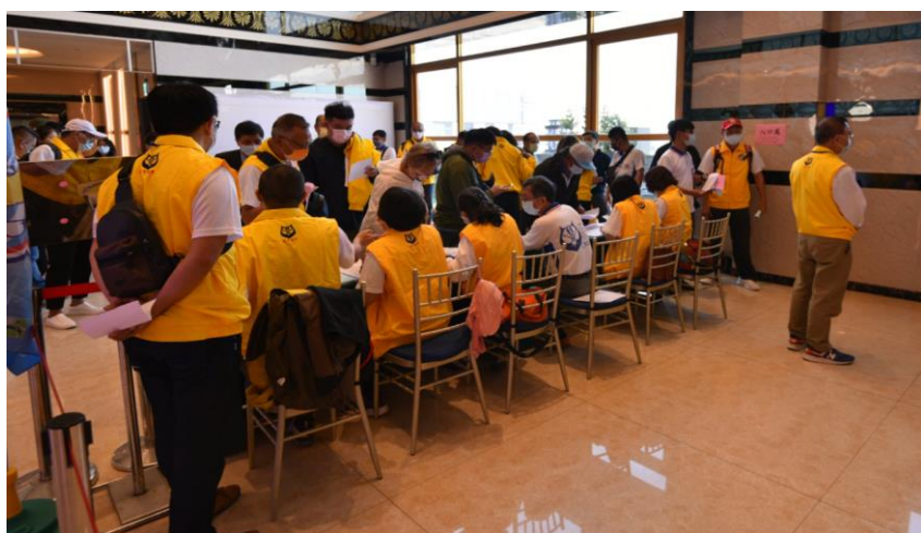
主任管理員巡視會員領票情形