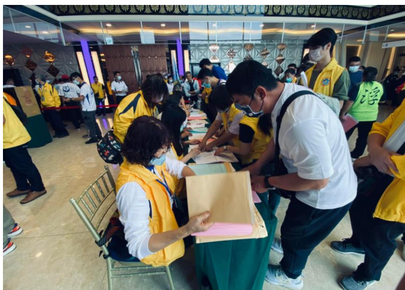
領票員查驗會員選舉資格