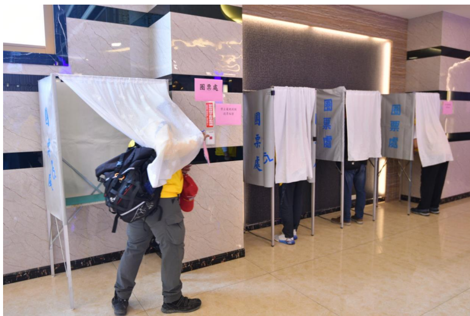
會員在圈票處圈票情形