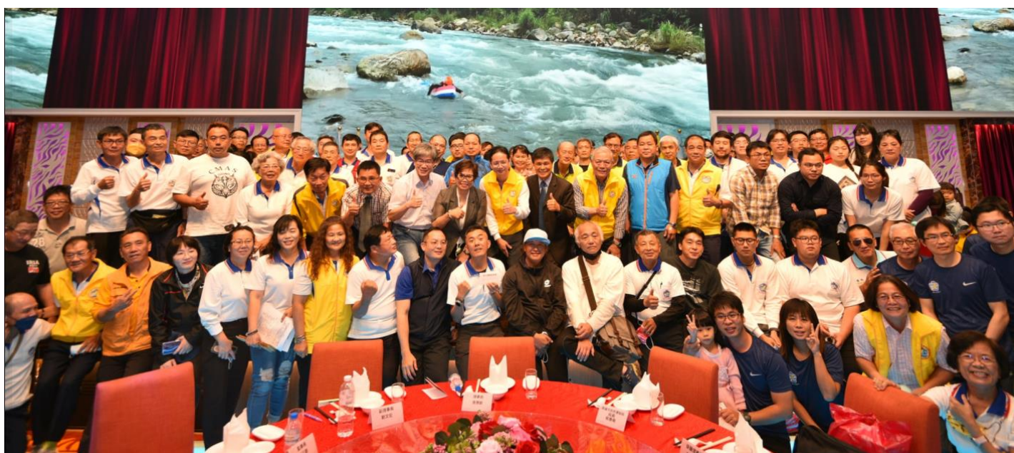
貴賓與會員大合照