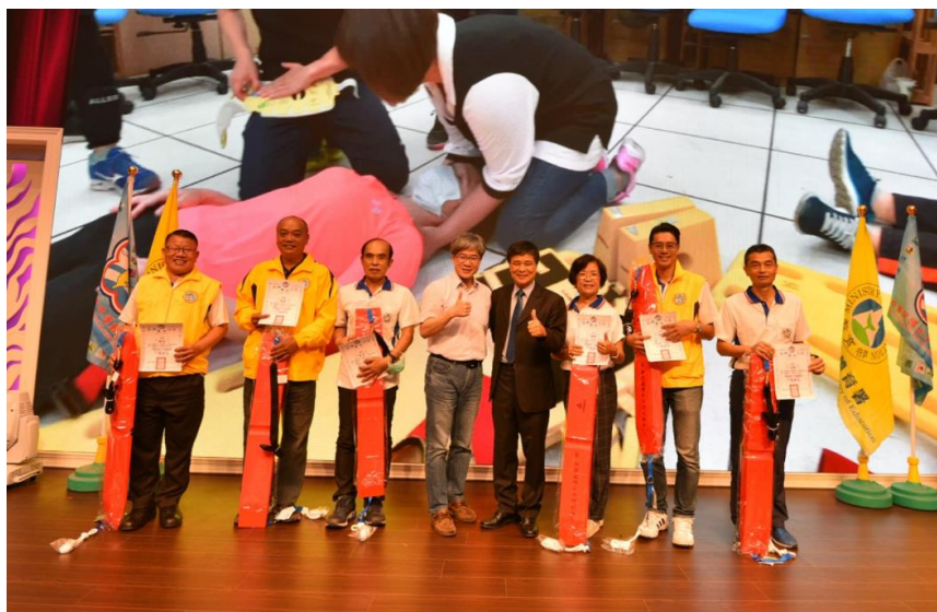
頒發有功人員及單位獎勵_2